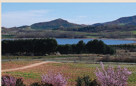
5. La Grajera