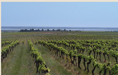
2. Costières de Nîmes