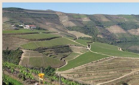
6. Alto Douro