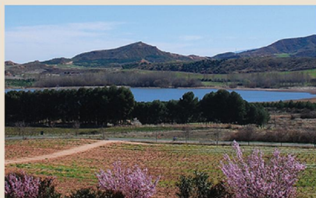
5. La Grajera