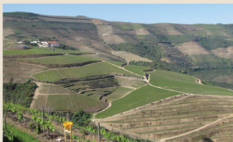
6. Alto Douro