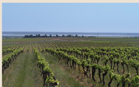
2. Costières de Nîmes