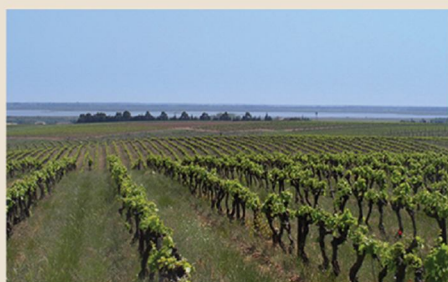
2. Costières de Nimes